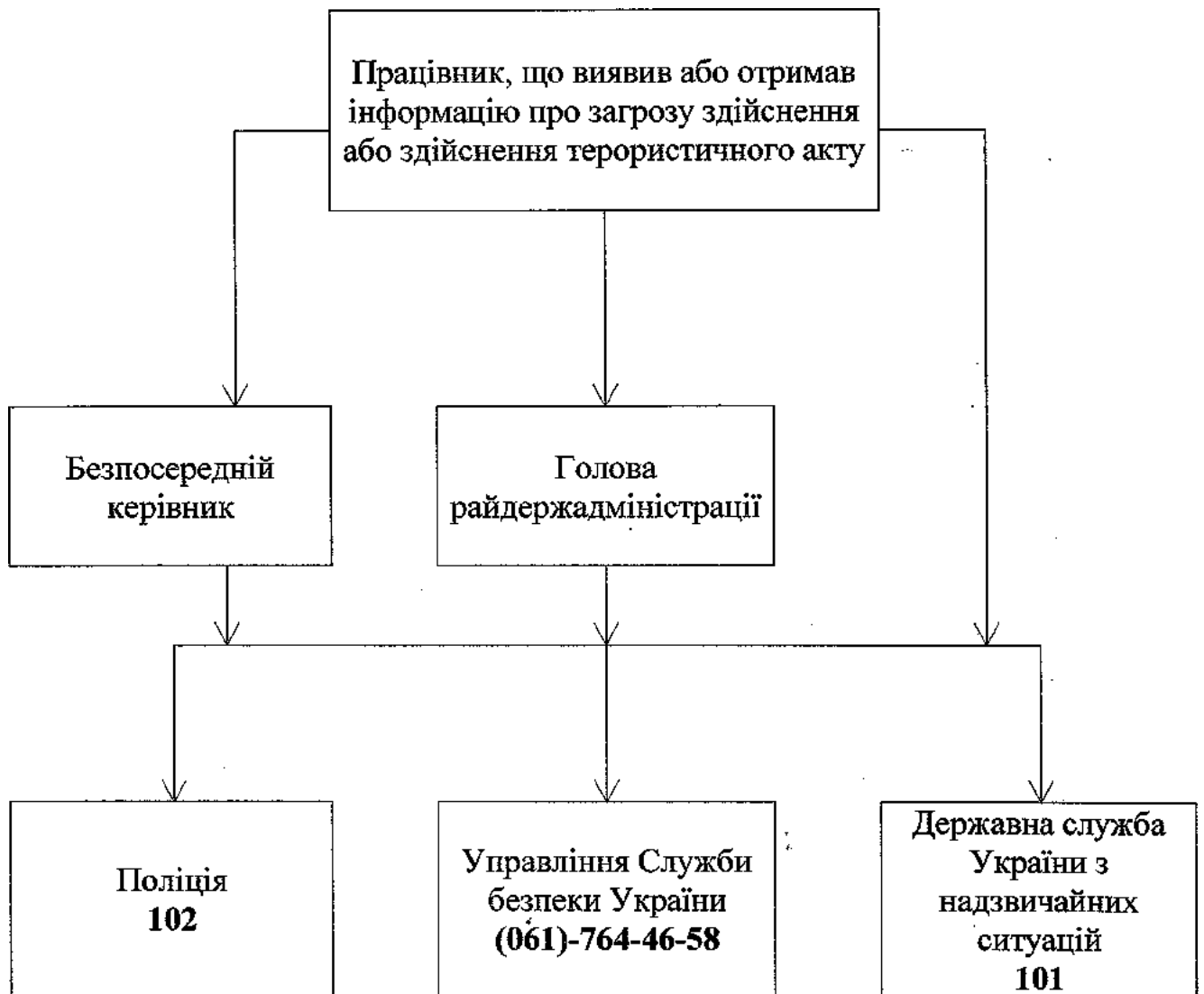
СХЕМА ОПОВІЩЕННЯ у Запорізькій райдержадміністрації на випадок загрози виникнення або виникнення терористичного акту